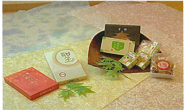
3000円クーポンプラン③