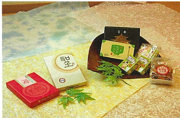
3000円クーポンプラン③