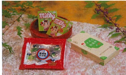
1000円クーポンプランB