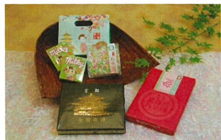
2000円クーポンプランD