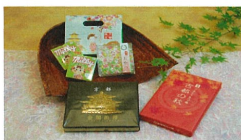
2000円クーポンプランB