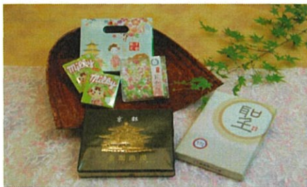
2000円クーポンプランA