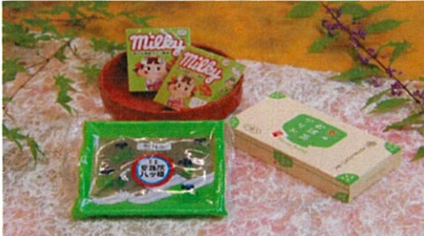
1000円クーポンプランA