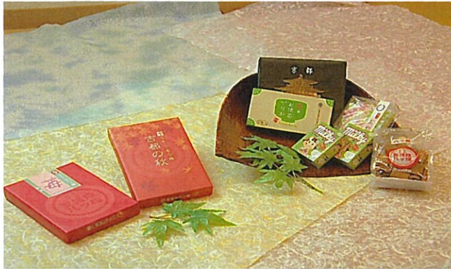
3000円クーポンプラン①