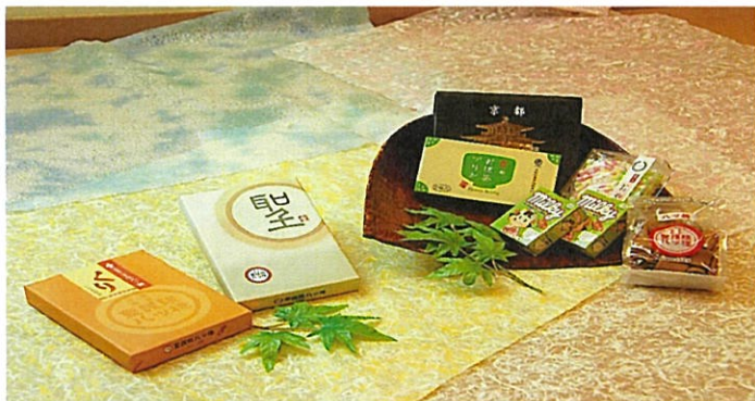
3000円クーポンプラン④