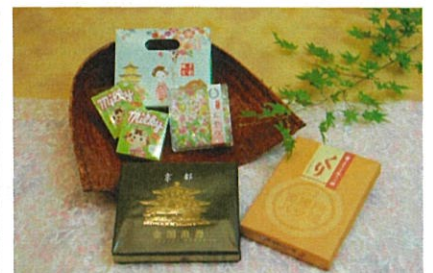
2000円クーポンプランC